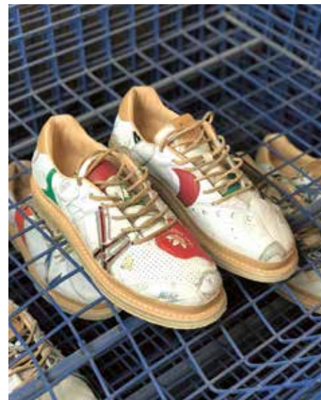
Colour Pop Patchwork , skor tillverkade av återbrukat läder av Peterson Stoop, 2023.