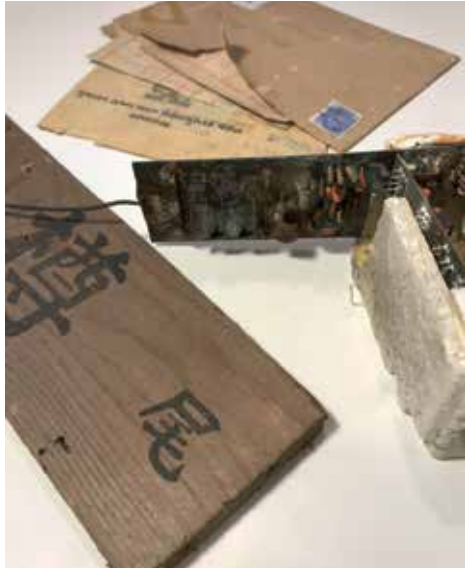
Exempel på vrakgods som hittats i Glommen och som visas i monterutställningen Vraga som hobby .