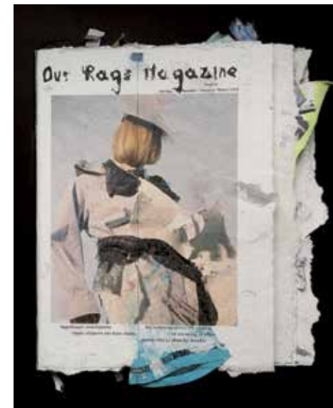
Our Rags Magazine av formgivaren Elisa van Joolen och fotografen Aimée Zito Lema är en gestaltning på hur ett mode magasin kan se ut i en framtid utan naturresurser, där omvandling och återbruk är enda vägen.