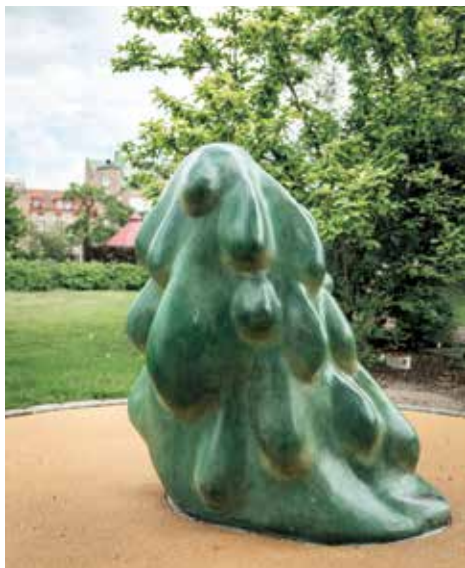
Jennifer Forsberg, Grön fru , 2019

Begränsat antal platser. Föranmäl dig via e-post till museibokning@falkenberg.se och ange namn och telefonnummer samt aktivitetens datum och tid.