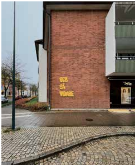
Sara Kallioinen Lundgren, Och så vidare , 2023, betongrelief på en fastighet vid Holgersgatan i Falkenberg.