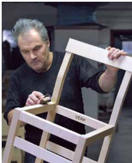
Stolfabriken i Tibro är en av de anrika svenska möbelproducenter som tillverkar designföretaget Verks möbler.