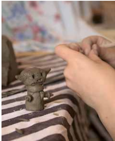
Skapande i lera under en av konstnären Jelena Rundqvists workshopar med skolbarn i Falkenberg.