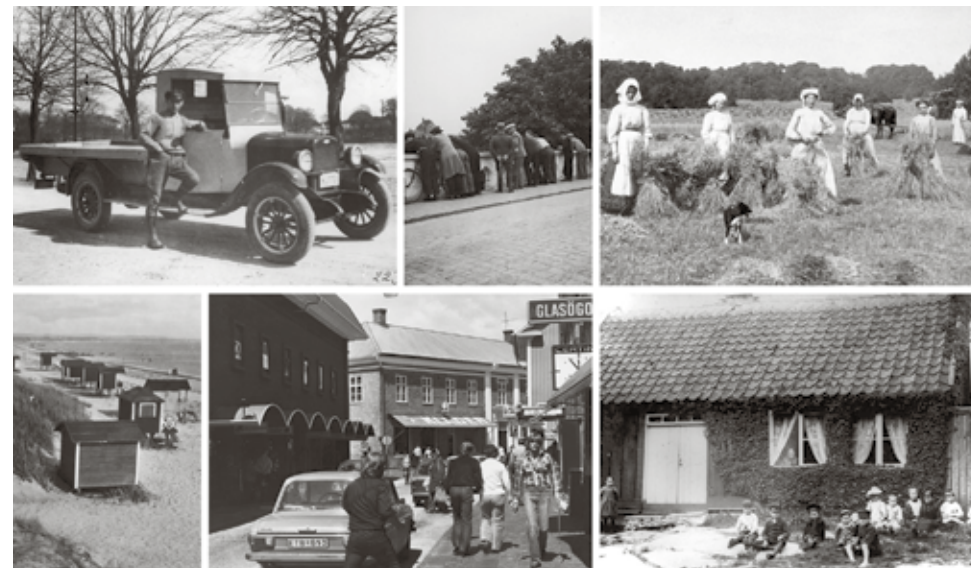
Några av de historiska fotografier från Falkenberg med omnejd som idag finns på Digitalt Museum.

Minnen kan vara från igår eller nedärvda från för länge sedan. Under hösten startade Rian en digital insamling av minnen och berättelser från Falkenberg med omnejd på den nationella webbplatsen Minnen. Allmänheten och skolan uppmuntras att skicka in bilder, berättelser, film och ljud som hör samman med Falkenberg. Dessa publiceras på Minnen och sparas även i museiarkivet för framtida generationer. Under våren är målet att Rians nya kulturhistoriska webbplats Stadens Nycklar ska lanseras, och där kommer inskickade minnen att lyftas fram under olika teman.