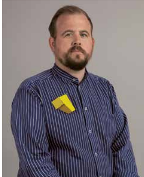
Sara Borgegård-Ålgå, Concrete , 2022, brosch i lackerat stål. Tillhör Smyckoteket.