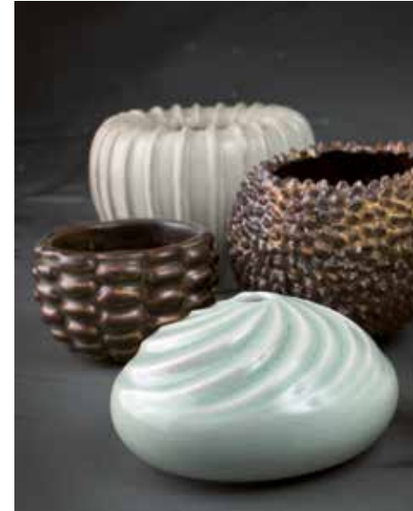
Keramik av Arne Bang, Axel Salto, Ann-Charlotte Ohlsson och Olle Alberius från BIM Collection.

bjuder på kaffe och en matig smörgås. Deltagande är kostnadsfritt. OBS! Föransökan till museibokning@falkenberg.se. Ange eventuella allergier vid anmälan. Det är också möjligt att utan kostnad boka ett hembesök av Smyckoteket. Om du samlar en grupp vänner eller arbetskamrater kan Rians medarbetare komma med en del av samlingen och berätta om smyckena medan ni provar dem.