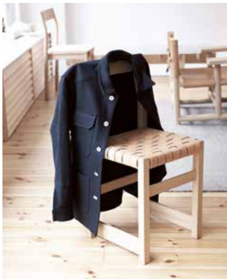
Ulljackan Findor från A New Sweden och stolen V.DE.01 från Verk.